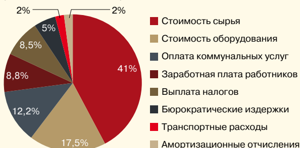
Рис. 3. Составляющие цены на хлебопекарную продукцию